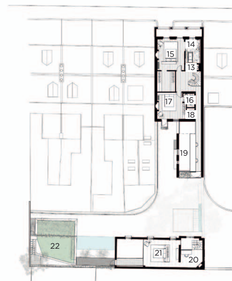
First floor plan