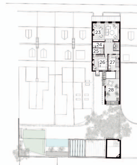
Second floor plan