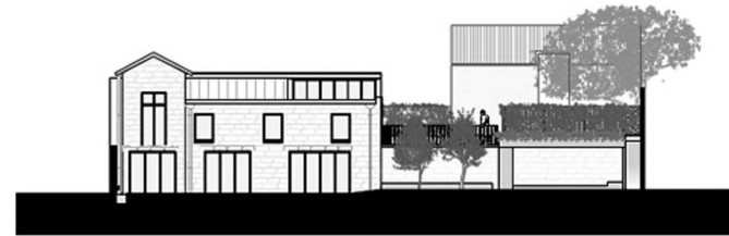
Stable front elevation